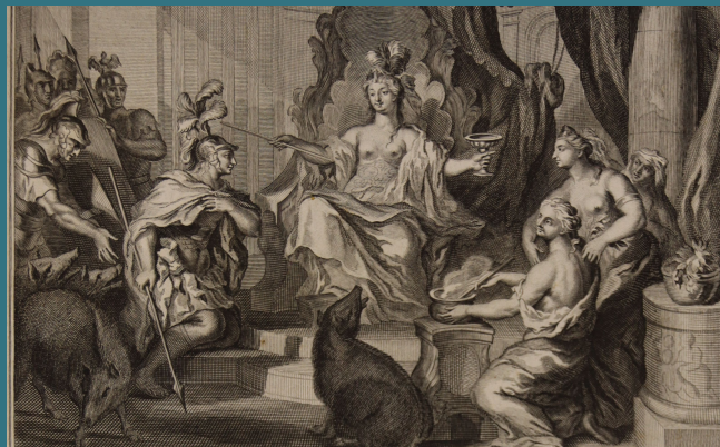
Les compagnons d'Ulysse changés en porcs par Circé

Le poison de Circé n'ayant aucun effet sur Ulysse, il arrive à lui faire prêter serment de rendre l'apparence humaine à ses compagnons et de lui offrir l'hospitalité. Ils resteront une année sur l'île à se reposer et festoyer. Avant de partir, Circé leur conseille d'aller dans les Enfers pour rencontrer le devin Tirésias qui sera capable de leur dire le chemin de retour.