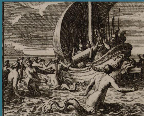
Ulysse qui résiste à la tentation des sirènes

9 Ils passent par un lieu extrêmement dangereux, celui des monstres Charybde et Scylla. En évitant Charybde, ils passent trop près de Scylla qui dévore six membres de l'équipage.